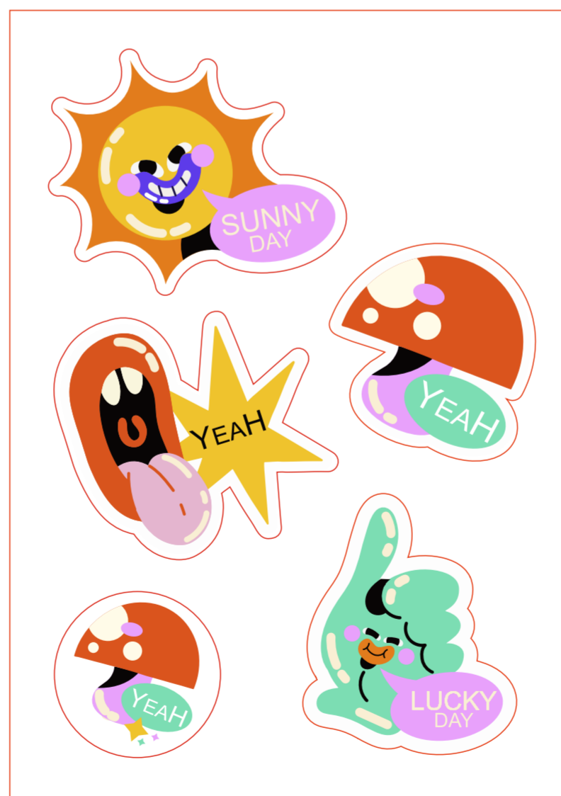
Слой(группа) для печати