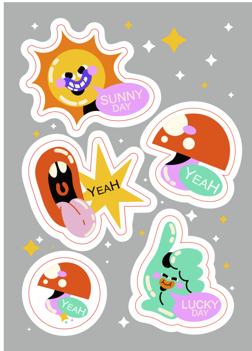
Слой(группа) для печати